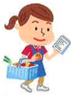
生活必需品の買い物