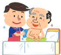
着替えの介助・体位変換